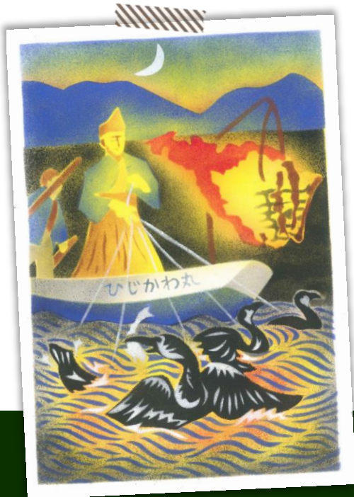
第18回 一般の部/大賞作品